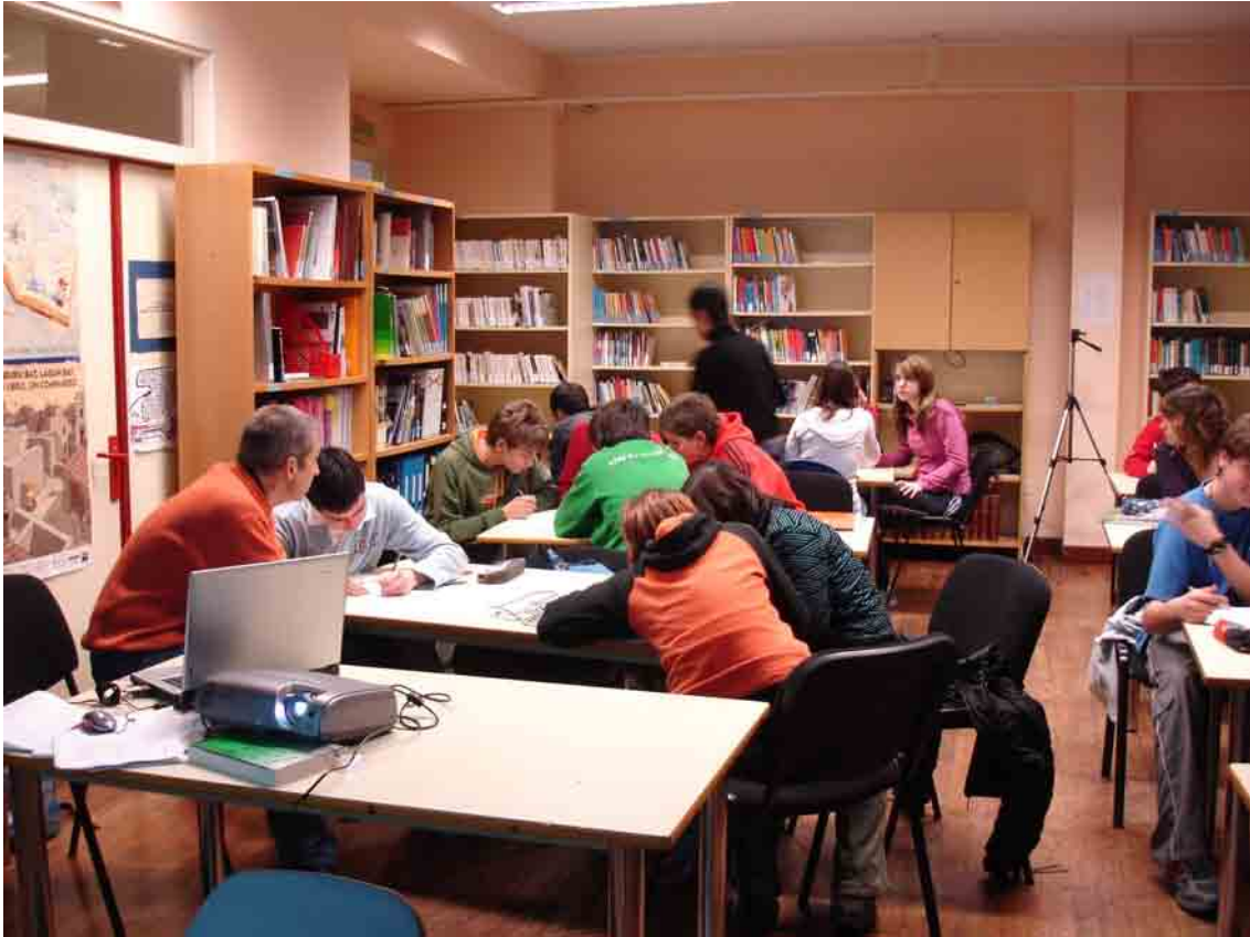
Elizatxo ikastolan Hirigintza eta generoa tailerrean, 1. saioa