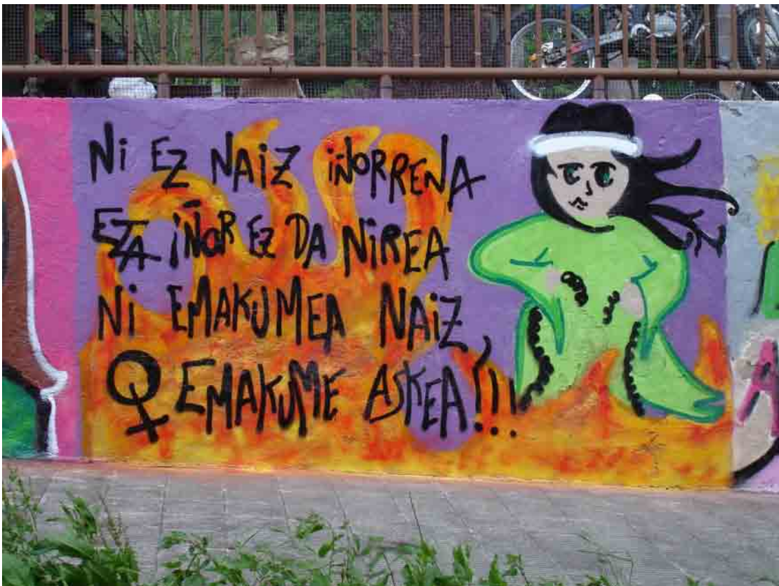
Hernaniko Hiri Debekatuaren Mapa Edurne Mendizabal Tolosa - Hernaniko Udaleko Berdintasun Saila eta Berdintasun Kontseilua. Inem Toki Korporazioak programa 2.007 eta 2.008