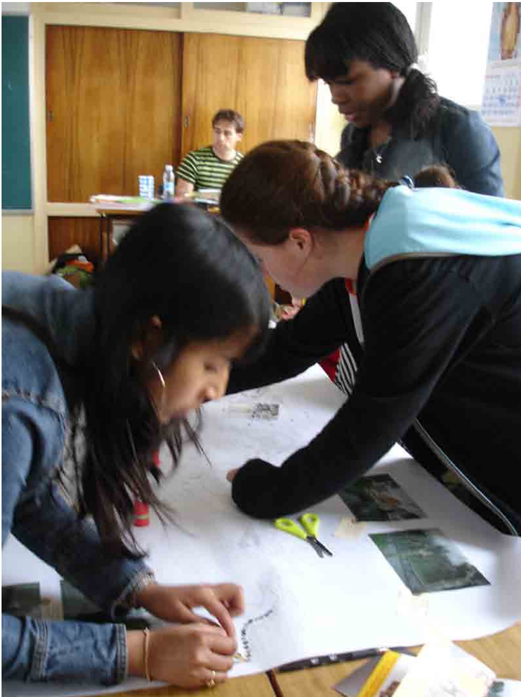
Inmaculada ikastetxea Hirigintza eta generoa tailerrean, 2. saioa