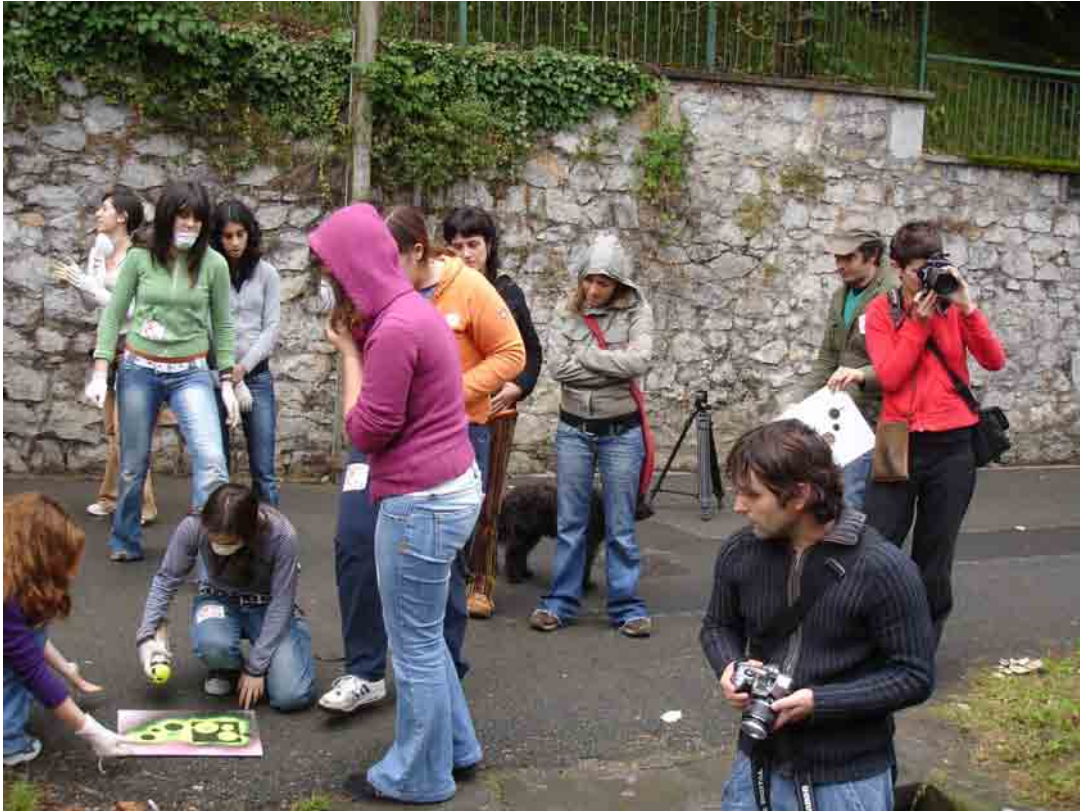
Langileko neskak "Jendetze Lanak"egiten